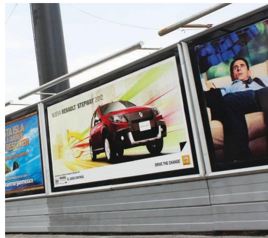
Anuncios en vallas